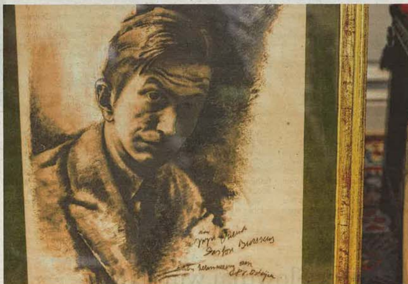
Tekening van Paul van Ostaijen door Floris Jespers.