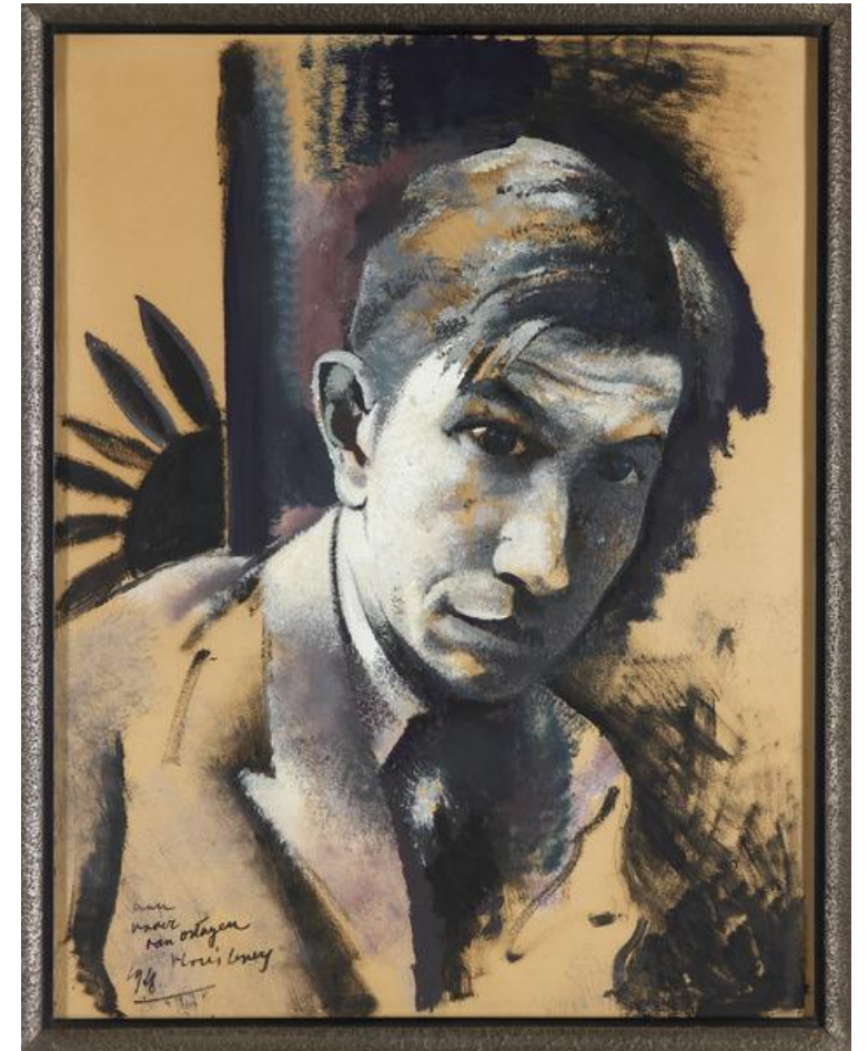
Paul van Ostaïjen

DAA-AG VIS dag lieve vis dag klein visselijn mijn